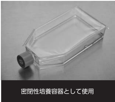
密閉性培養容器として使用