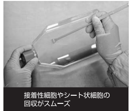
接着性細胞やシート状細胞の回収がスムーズ