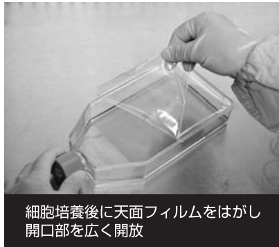
細胞培養後に天面フィルムをはがし開口部を広く開放