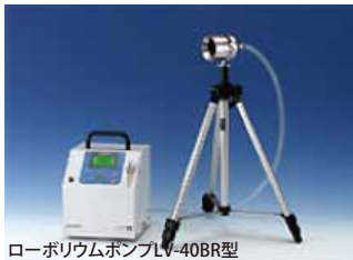
ローボリウムポンプLV-40BR型