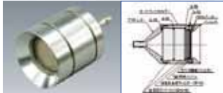
放射性ヨウ素サンプラー用ホルダー 型式RI-55